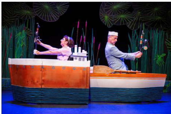
© Gilles Destexhe - Province de Liège