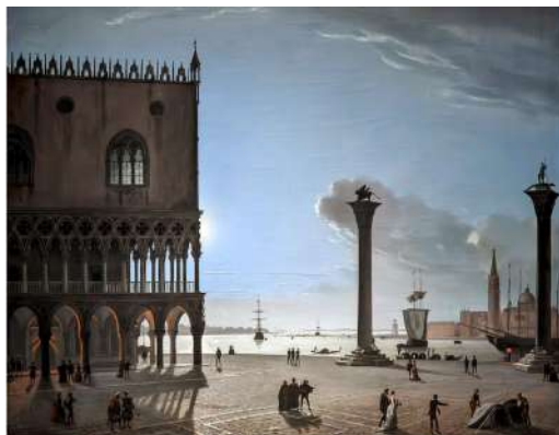
Ippolito Caffi: Notturmo Venezia 1850 Fondazione Querini Stampalia